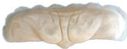
Vampir Stirn 3 Art. LP02591

Stirnband mit Elfenohren Latex hautfarben