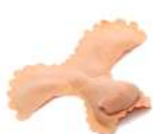
Faun-Gesicht Latex hautfarben

Wir bieten eine ganze Reihe an Gesichtsapplikationen an. Material ist Latex und Latexschaum. Gelebt wird mit Mastix, oder Spezialkleber. Mehr online unter www.theatermakeup.de/maskenbildnerei/latexteile/ , Sonderanfertigungen auf Anfrage.