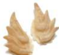
Elf-Dreispitz Ohren Art. EL1440853