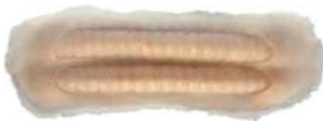
Schlauchimplantat Art. LPQ2715