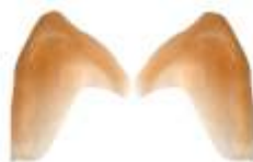
Elfen-Ohren Spitzen Art. LP02594