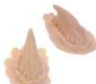
Flach Hörnchen Latex hautfarben