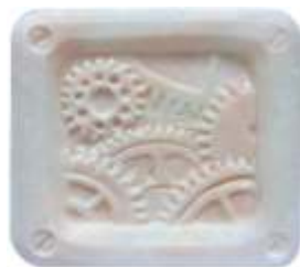
Getriebeplatte Art. LPQ2713