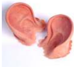
Maus-Ohren Art. EL1460253