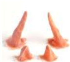
Klein Hörnchen Set 1 Latex hautfarben