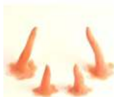
Klein Hörnchen Set 2 Latex hautfarben