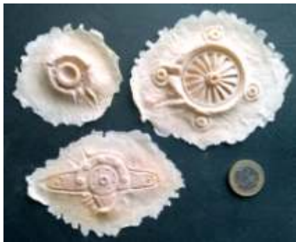
Biomechanik Set - natur