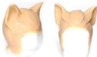
Katzen-Haube Latex hautfarben