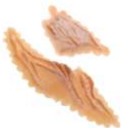
Rißwunde 1 Art. EL1810153