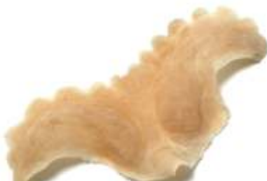
Vampir Stirn 1 Art. EL1230153