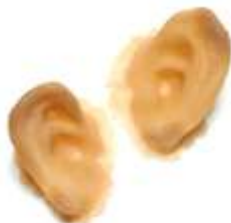
Ohren Groß Art. EL1450153

Sonderanfertigungen auf Anfrage Special designs on request