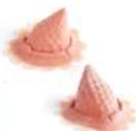
Noppen Hörnchen Latex hautfarben