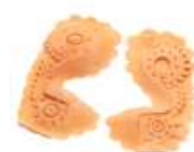
Mecha-Gesicht Latex hautfarben