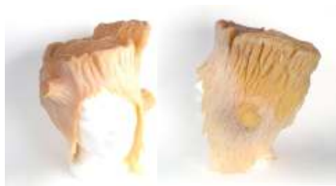
Baumstumpf-Haube Latex hautfarben