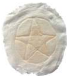
Pentagramm Art. LP02689