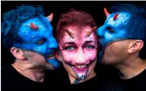
Team Senjo Color mit Hörnchen...