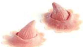
Mini Hörnchen Latex hautfarben