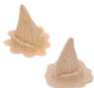
Dreikant Hörnchen Latex hautfarben