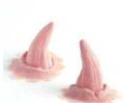
Normal Hörnchen Latex hautfarben