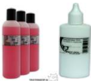
Senjo-Color Spezialkleber & Entferner Special Glue & Remover