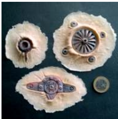
Biomechanik Set - coloriert