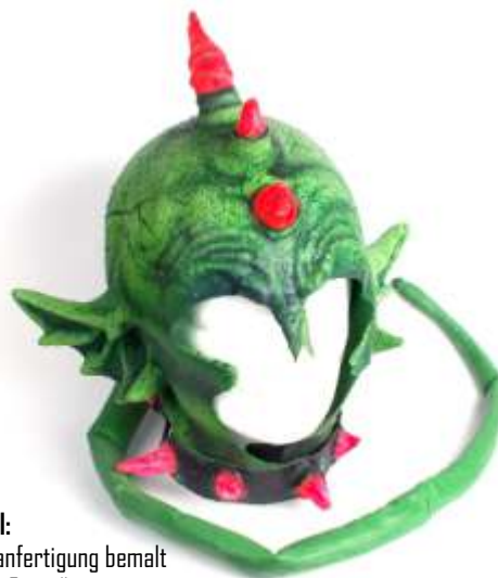
Beispiel: Sonderanfertigung bemalt „Grüner Gnom“