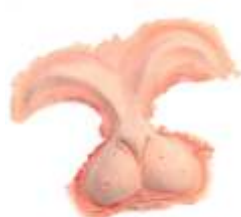
Hasen Gesicht Latexschaum hautfarben