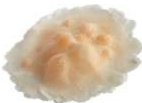
Pestbeulen Art. LP02682