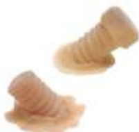
Schrauben im Körper