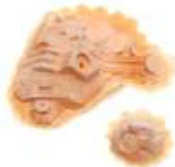
Cyborg-Auge Latex hautfarben