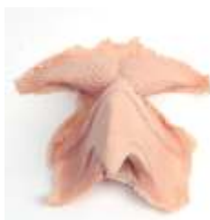
Adler Gesicht Latexschaum hautfarben