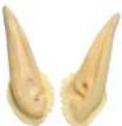
Elfen-Ohren lang Art. EL1440753