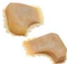
Marmor Flach Ohren Art. EL1470153