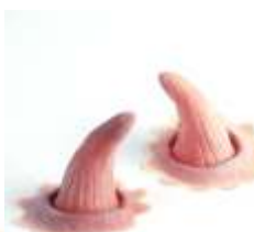
Krumm Hörnchen Latex hautfarben