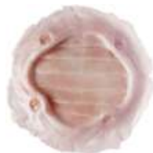
Lüftungsklappe Art. LPQ2717