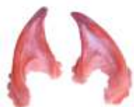
Beispiel in Rot Spitz-Ohren Art. EL1440953