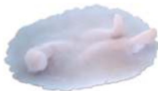
Hautwürmer Art. LP02696

Mehr online unter www.theatermakeup.de/maskenbildnerei/latexteile/