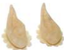
Spitz-Ohren klein, geschlossen Art. EL1440453