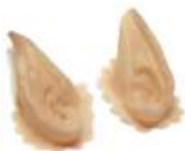
Elfen-Ohren Art. EL1440353