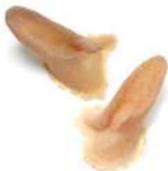
Faun-Ohren Art. EL1460153