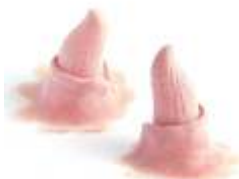
Jugend Hörnchen Latex hautfarben