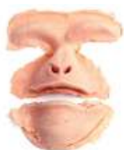
Affen Gesicht Latexschaum hautfarben