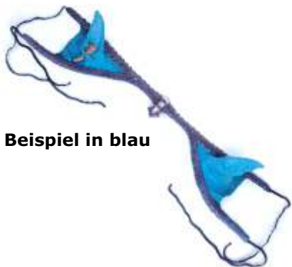
Beispiel in blau