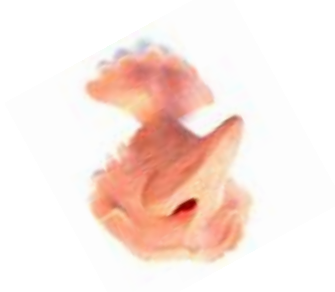
Grinse Spitz Näschen