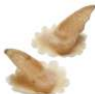
Orki-Ohren Art. EL1440553