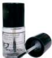
Mastix HD in der Pinselflasche