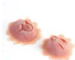
Babi Hörnchen Latex hautfarben