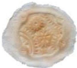
Zahnradwunde Art. LPQ2730