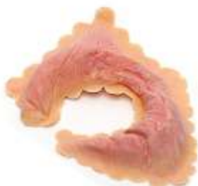
Boxer-Auge Art. EL1830353