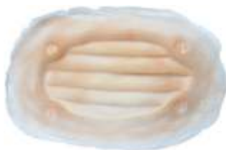
Lüftungsklappe Art. LPQ2729