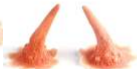
Dünn Hörnchen Latex hautfarben