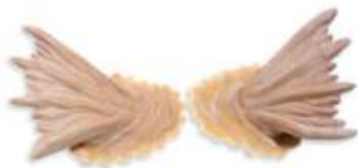
Fischflossen-Ohren Art. EL1460553