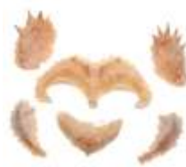
Echsen-Gesicht Latex hautfarben