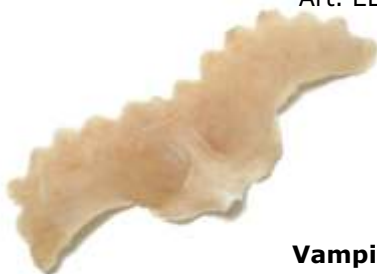
Vampir Stirn 2 Art. EL1230253