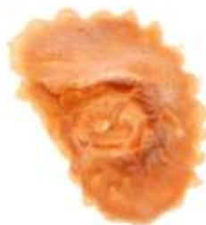
Robot-Auge Art. EL1870453